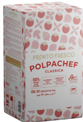
Polpachef classica con pomodori 100% italiani

Eignet sich für Teige, die lange Ruhezeit und eine verlängerte Gärung in Kühzellen erfordern.