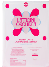
Mozzarella Julienne Fior di latte di Agerola 45% FIT SCHALE

Karton à 4 x 1.5 kg 010392 statt 6.90 6.70 kg