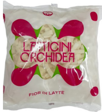
Mozzarella Julienne Fior di latte 45% FIT BEUTEL

Karton à 4 x 1.5 kg 010392 statt 6.90 6.70 kg