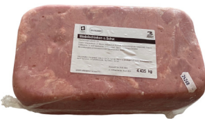
Prosciutto cotto (CH)

Stück à ca. 3 kg 020323 statt 15.40 14.90 kg