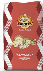
Farina Tipo 00 "Saccorosso"

Weizenmehl Typ 00 "rot" Farine de blé Type 00 "rouge"